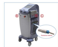
Lipolaser FG 660H-001 Multipads (Behandlungsplatten)